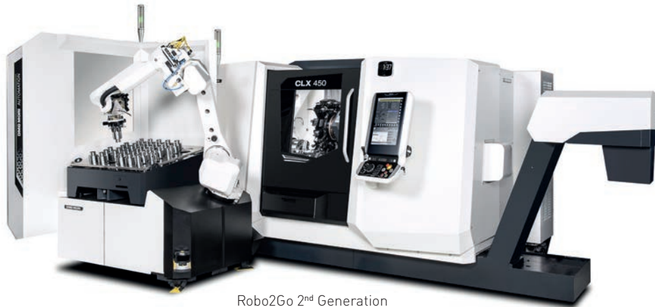
Robo2Go 2 nd Generation

Automationslösungen für CLX mit DMG MORI SLIMline 19" Touch-Steuerung auf FANUC iSeries